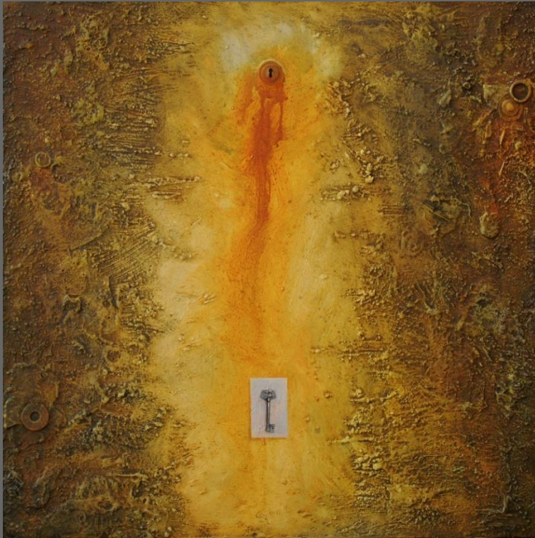
LA LLAVE , de la serie Huellas