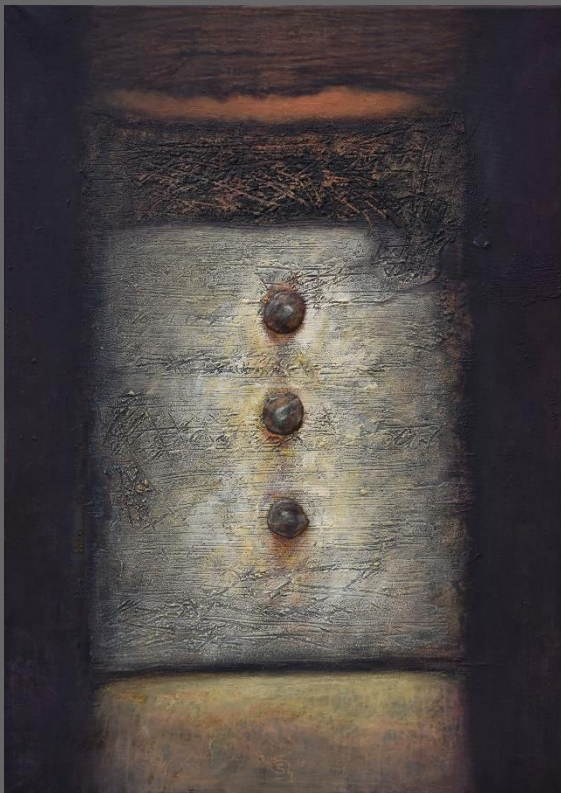
TU PRESENCIA , de la serie Huellas