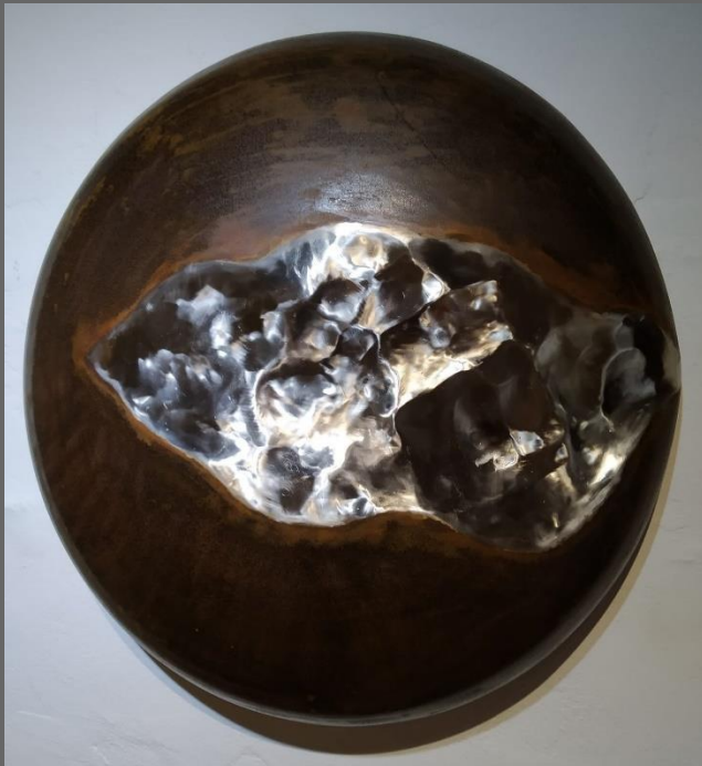
"Bajo la Piel"