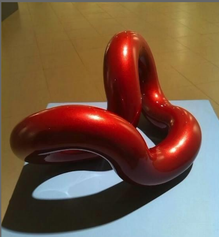
"INFINITO ROJO MÍSTICO 2" / "RED MISTYC INFINITE 2"