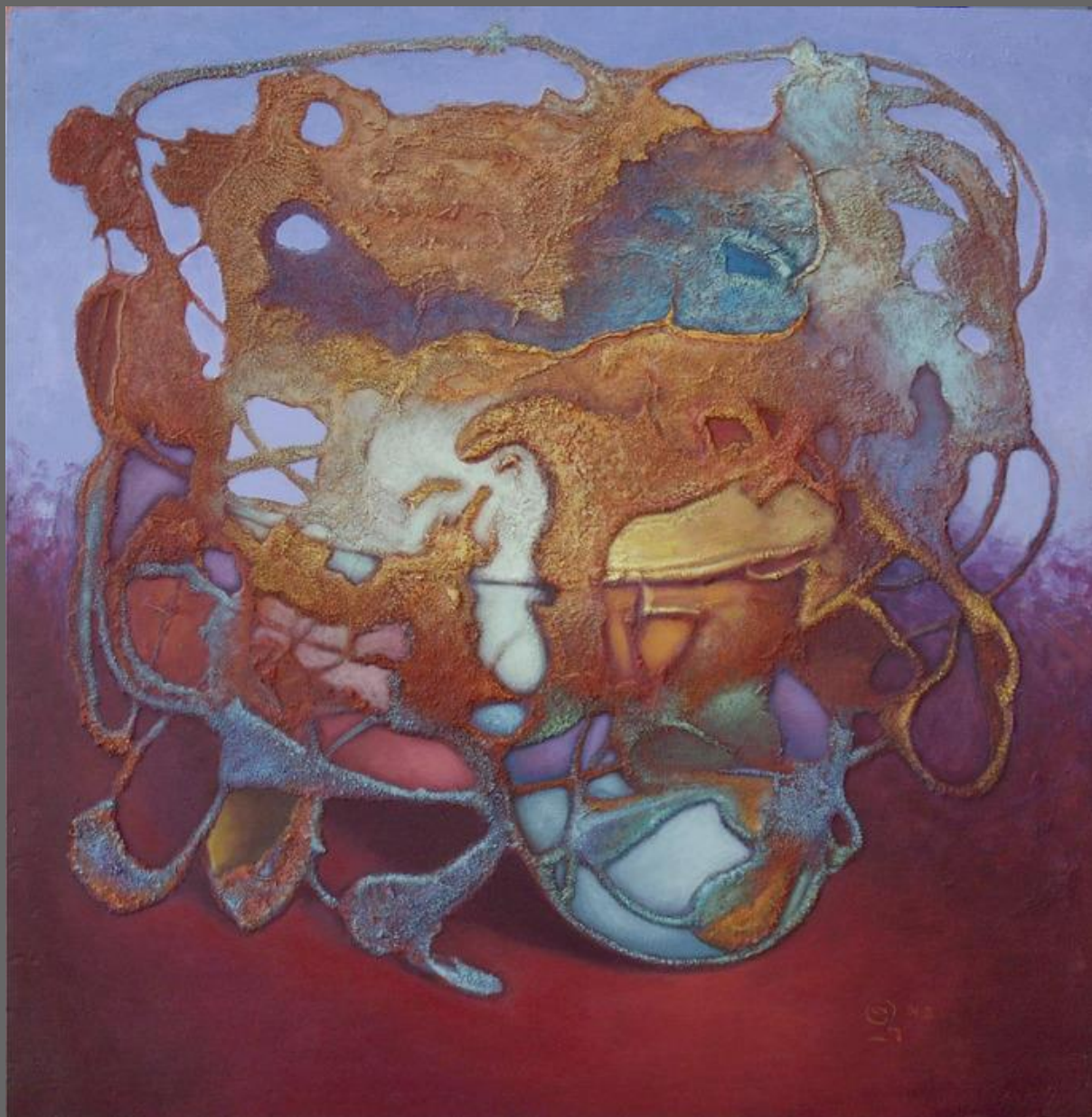
GEOCENTRISMO, de la serie Huellas / GEOCENTRISM, from Traces series

Técnica mixta sobre Madera / Mixed Technique on wood