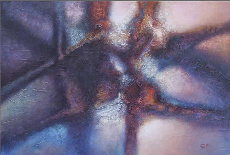
TRANSFORMACIÓN, de la serie Atmósferas / TRANSFORMATION, from The Atmospheres Series