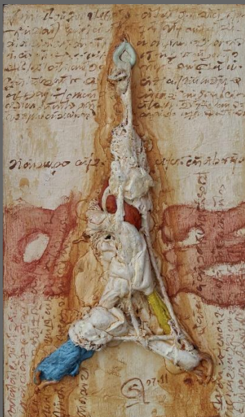
“DESEO”, de la serie Nudos / “DESIRE”, from Knots series