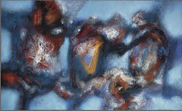
"IMPULSO", de la serie Atmósferas / "IMPULSE", from The Atmospheres series