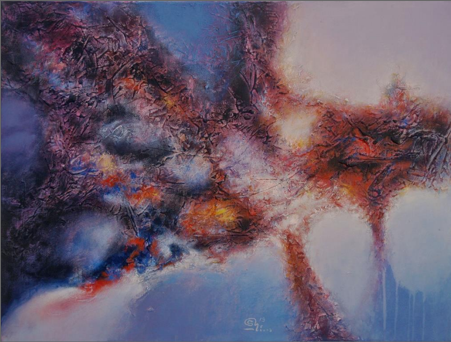
FÉNIX, de la serie Atmósferas / PHOENIX, from The Atmospheres series

Acrílico sobre Lienzo / Acrylic on Canvas