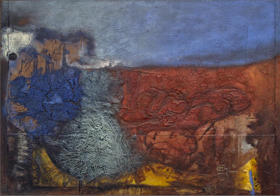
"AQUÍ Y AHORA", serie Huellas/