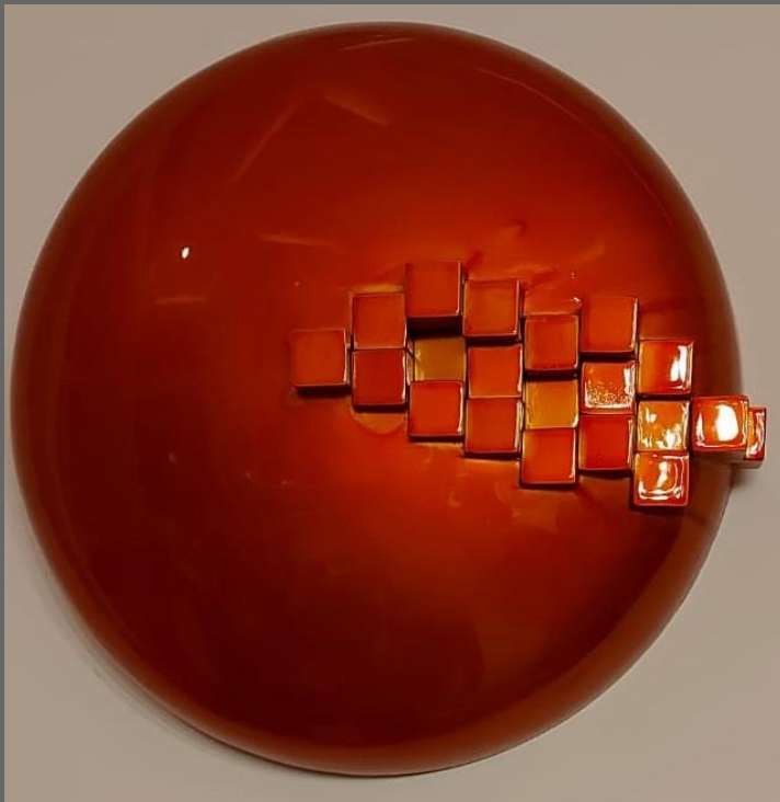
"DECONSTRUCCIÓN NARANJA" "ORANGE DECONSTRUCTION"