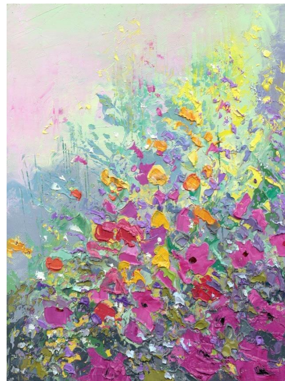
“FLORES SILVESTRES 3”