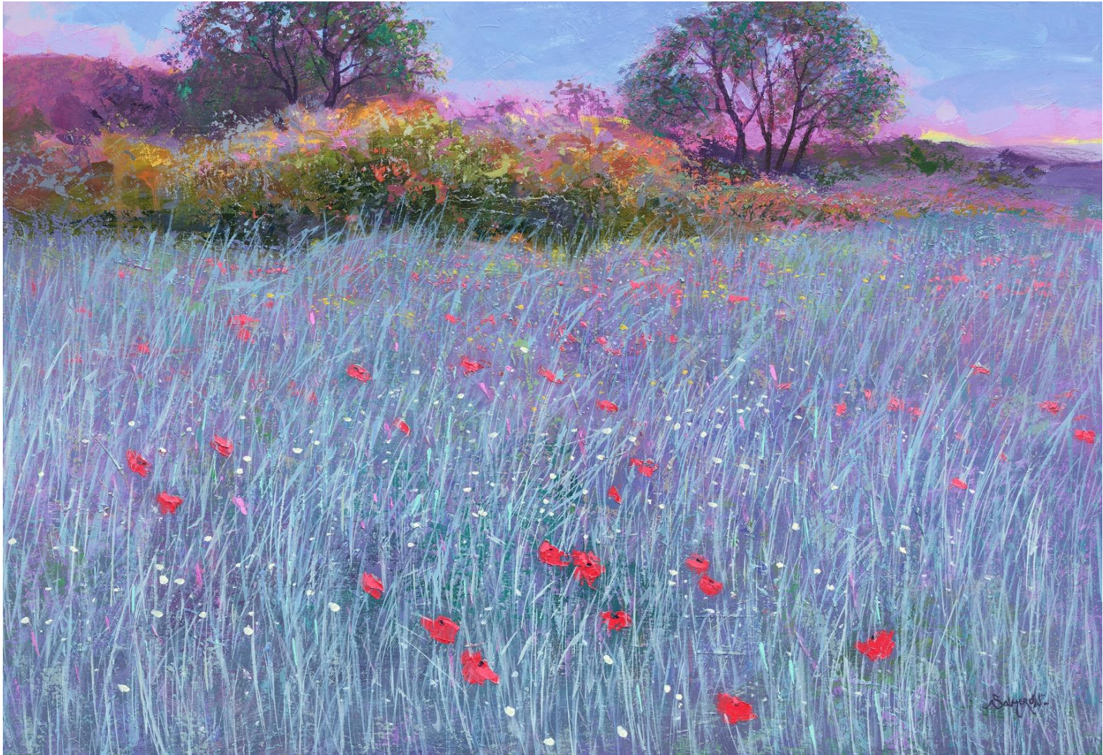
"CAMPO DE FLORES 14" Oleo/Lienzo. 65 x 95 cm 1300 €