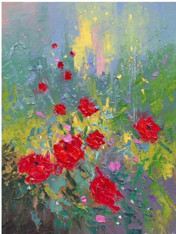
“FLORES SILVESTRES 2”