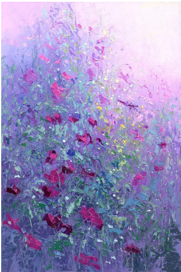
"CAMPO DE FLORES 15" Oleo/Lienzo. 45 x 30 cm 650 €