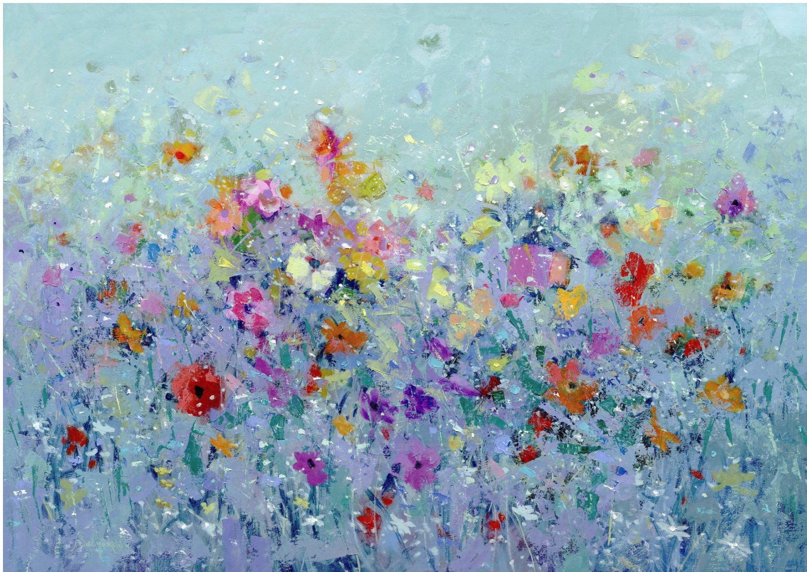
"CAMPO DE FLORES 1"