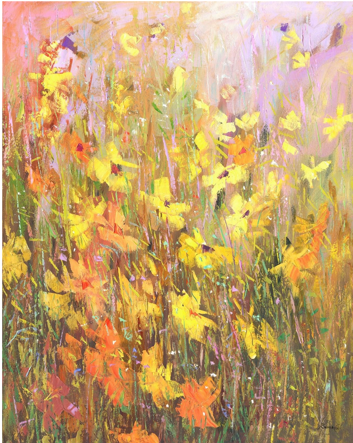
"CAMPO DE FLORES 8" Oleo/Lienzo. 96 x 77 cm 1500 €