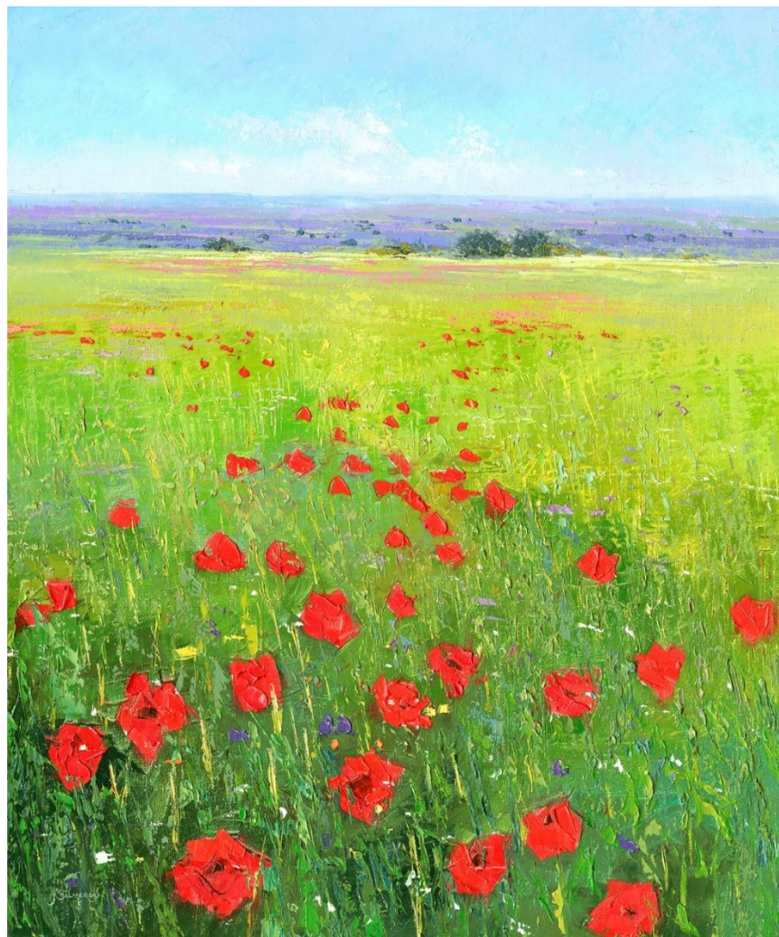
"CAMPO DE FLORES 13" Oleo/Lienzo. 55 x 46 cm 800 €