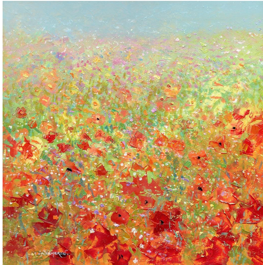
“CAMPO DE FLORES 6”