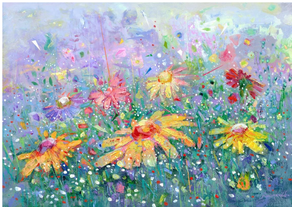
“CAMPO DE FLORES 7” Oleo/Lienzo. 57 x 40 cm 800 €