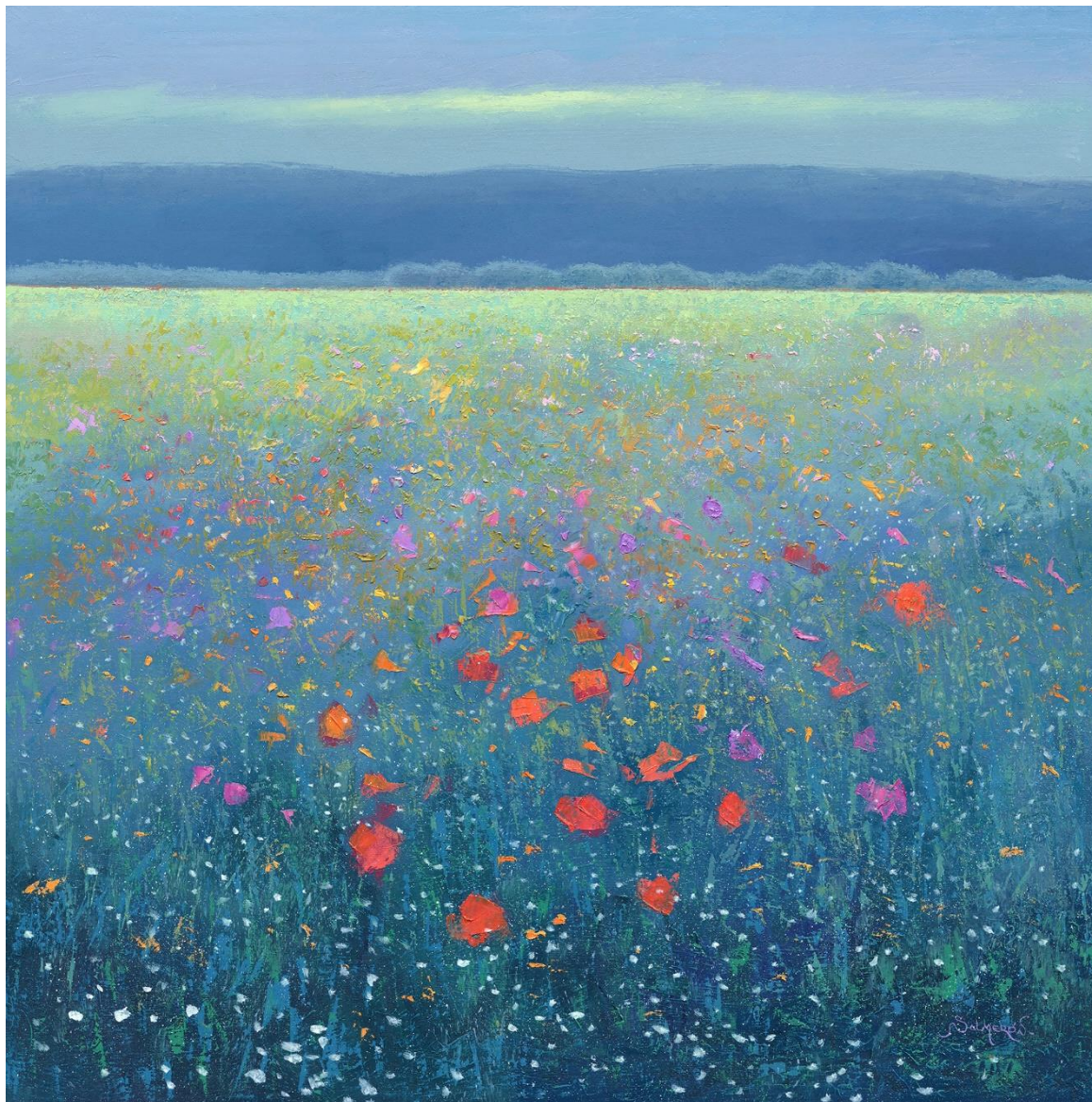
"CAMPO DE FLORES 4" Oleo/Lienzo. 75 x 75 cm 1200 €