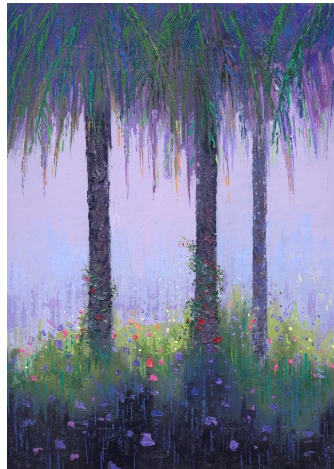
"PALMERAS" Oleo/Lienzo. 46 x 33 cm 650 €