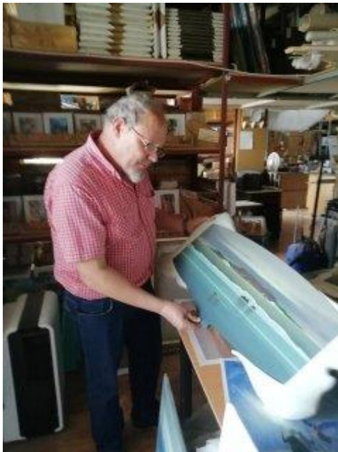
Artista en su estudio, Santa Úrsula, Tenerife

Profesora titular del Departamento de Historia del Arte. Universidad de La Laguna