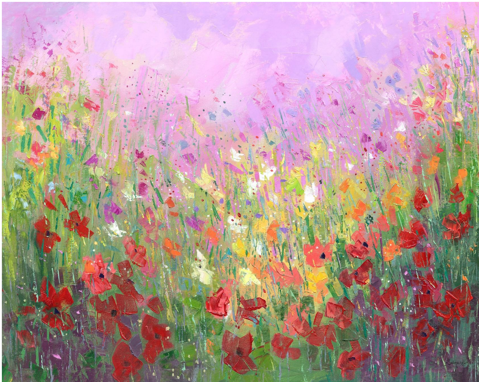
"CAMPO DE FLORES 9" Oleo/Lienzo. 73 x 92 cm 1300 €