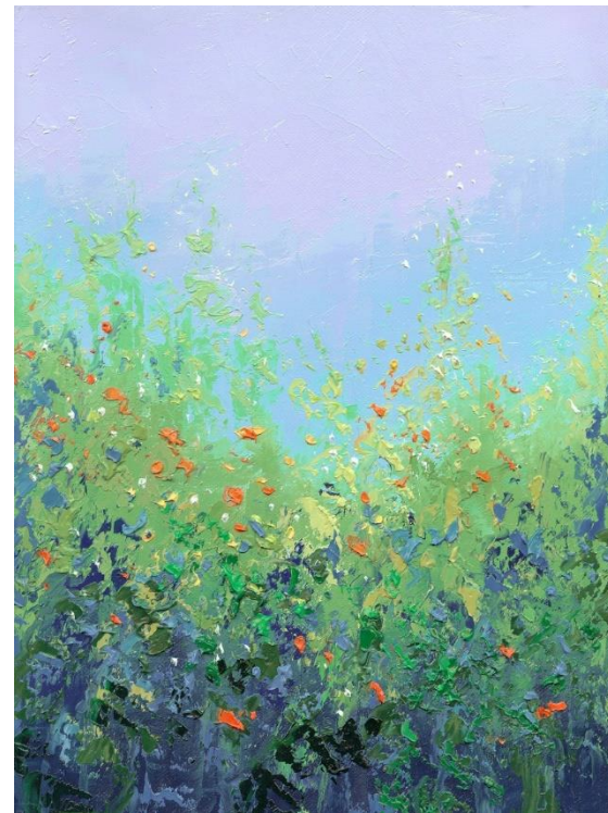
"FLORES SILVESTRES 4" Oleo/Lienzo. 21 x 21 cm 500 €