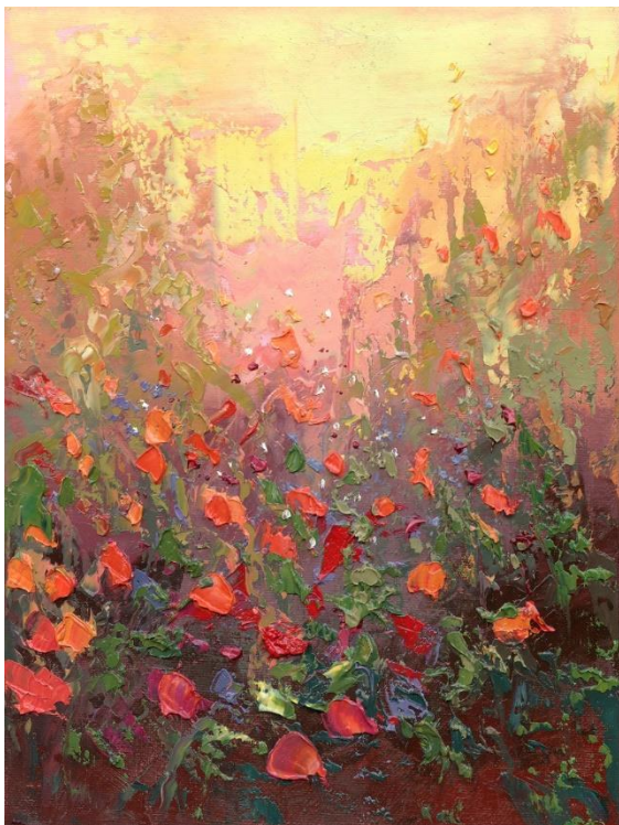
"FLORES SILVESTRES 1" Oleo/Lienzo. 21 x 21 cm 500 €