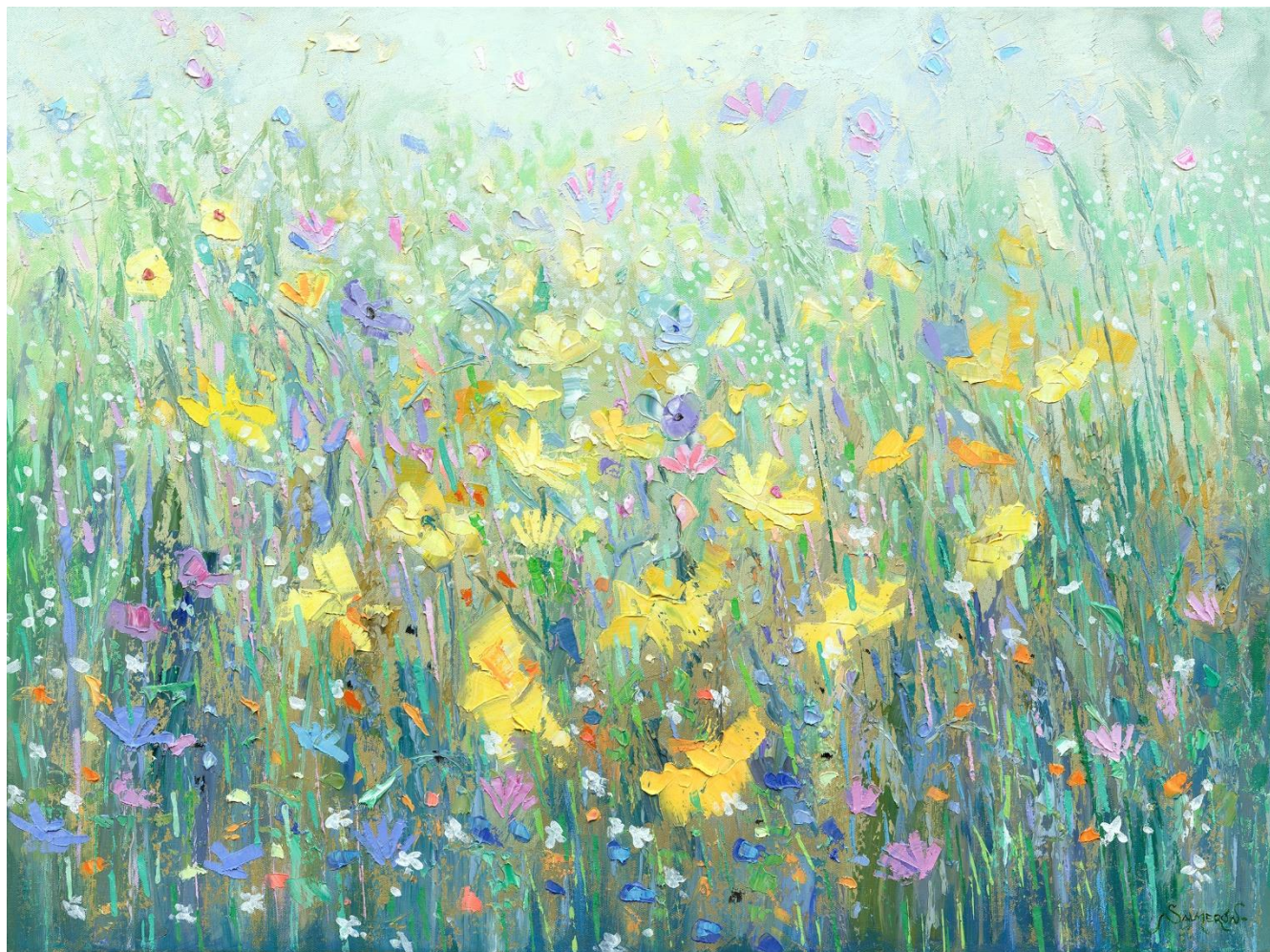
“CAMPO DE FLORES 12” Oleo/Lienzo. 54 x 73 cm 1000 €